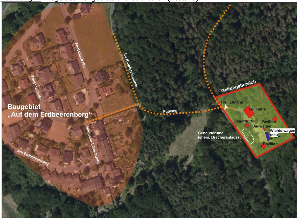
Abbildung 1: Lage des Plangebiets und Strukturen (Bestand)